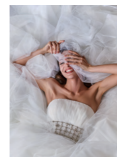
PICK UP BRAND 02